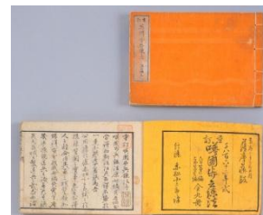
重訂 英国歩兵練法