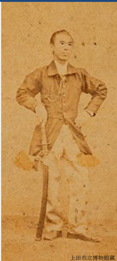
上田市立博物館蔵