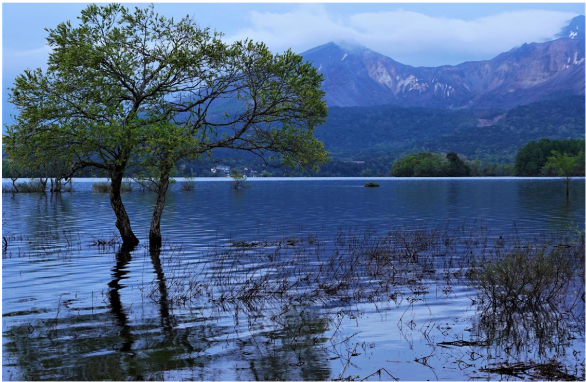
4. 桧原湖より磐梯山遠望