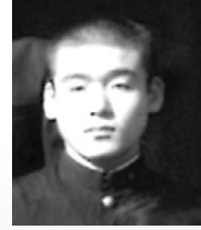
卒業アルバムより