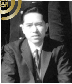
卒業アルバムより